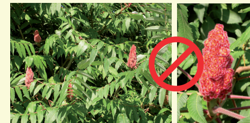
Sumac ou Vinaigrier ( Rhus thyphina )