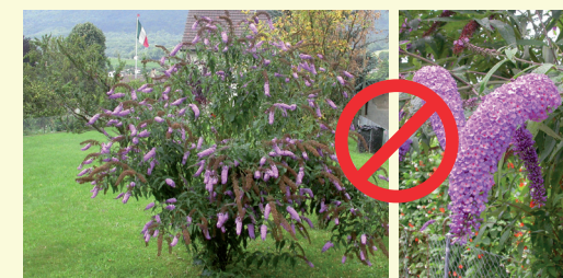
Arbre à papillons ( Buddleja davidii )