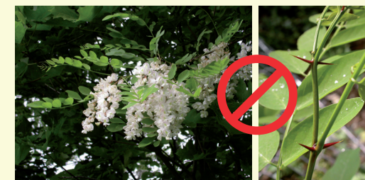
Robinier faux-acacia ( Robinia pseudoacacia )