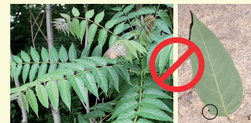
Ailante ( Ailanthus altissima )