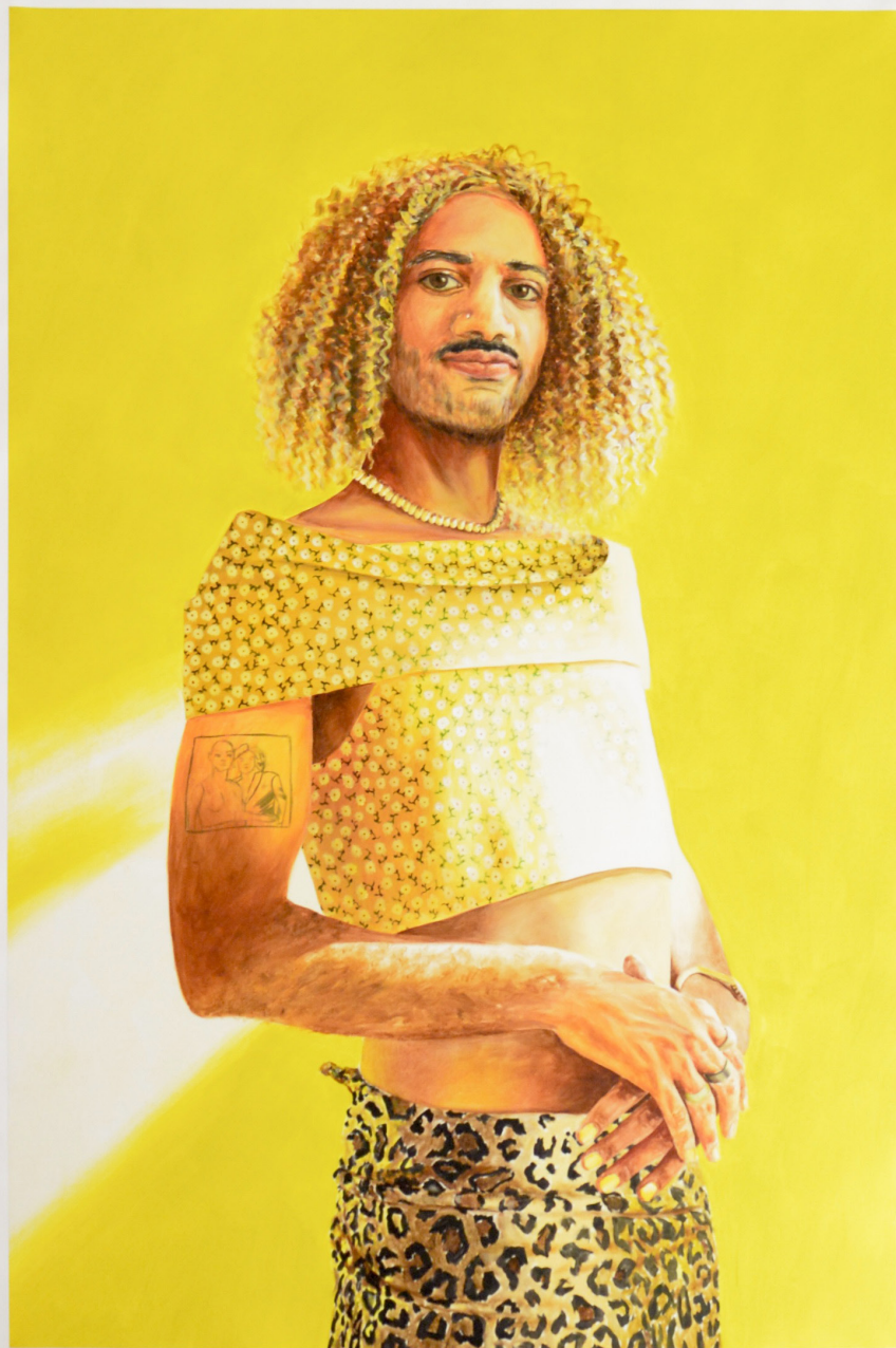
Avec les filles j'ai un succès fou - acrylique sur toile 180 x 120cm