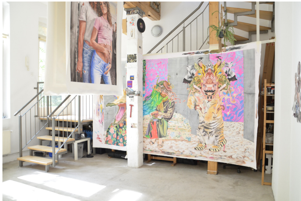
Open studio et pizzas avec les copains