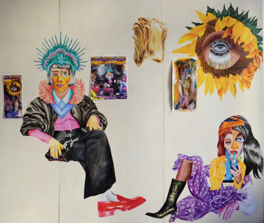
Trip sur le sofa 1/2 - acrylique sur bois - 400 x 240cm