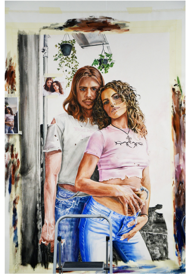
Tourner in dans le Us et Komm wir spielen - acrylique sur toile - 180 x 120cm