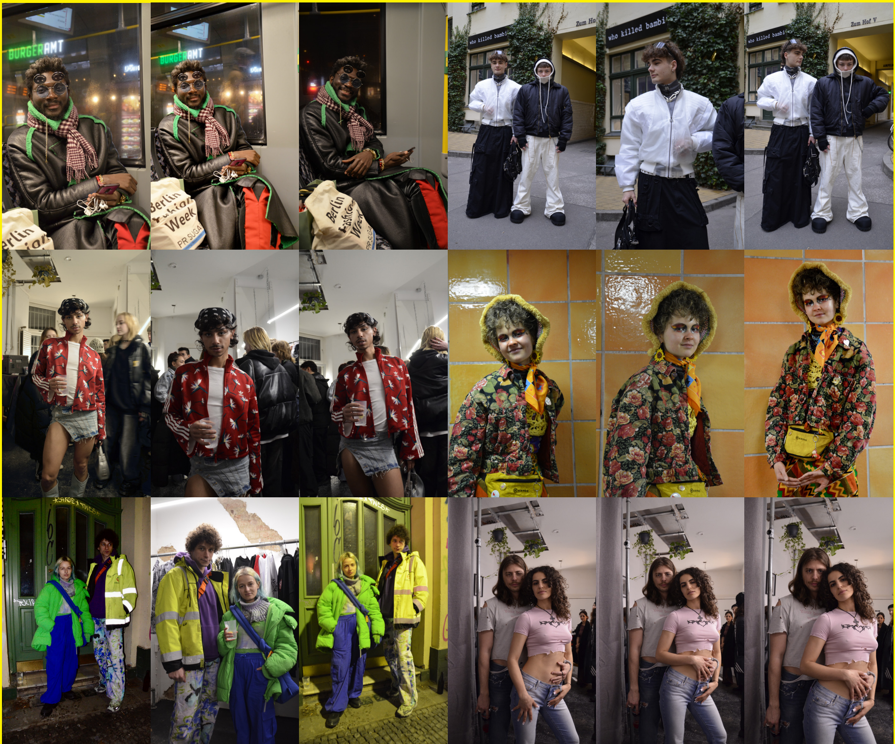
Photo shoot dans les rues berlinoises