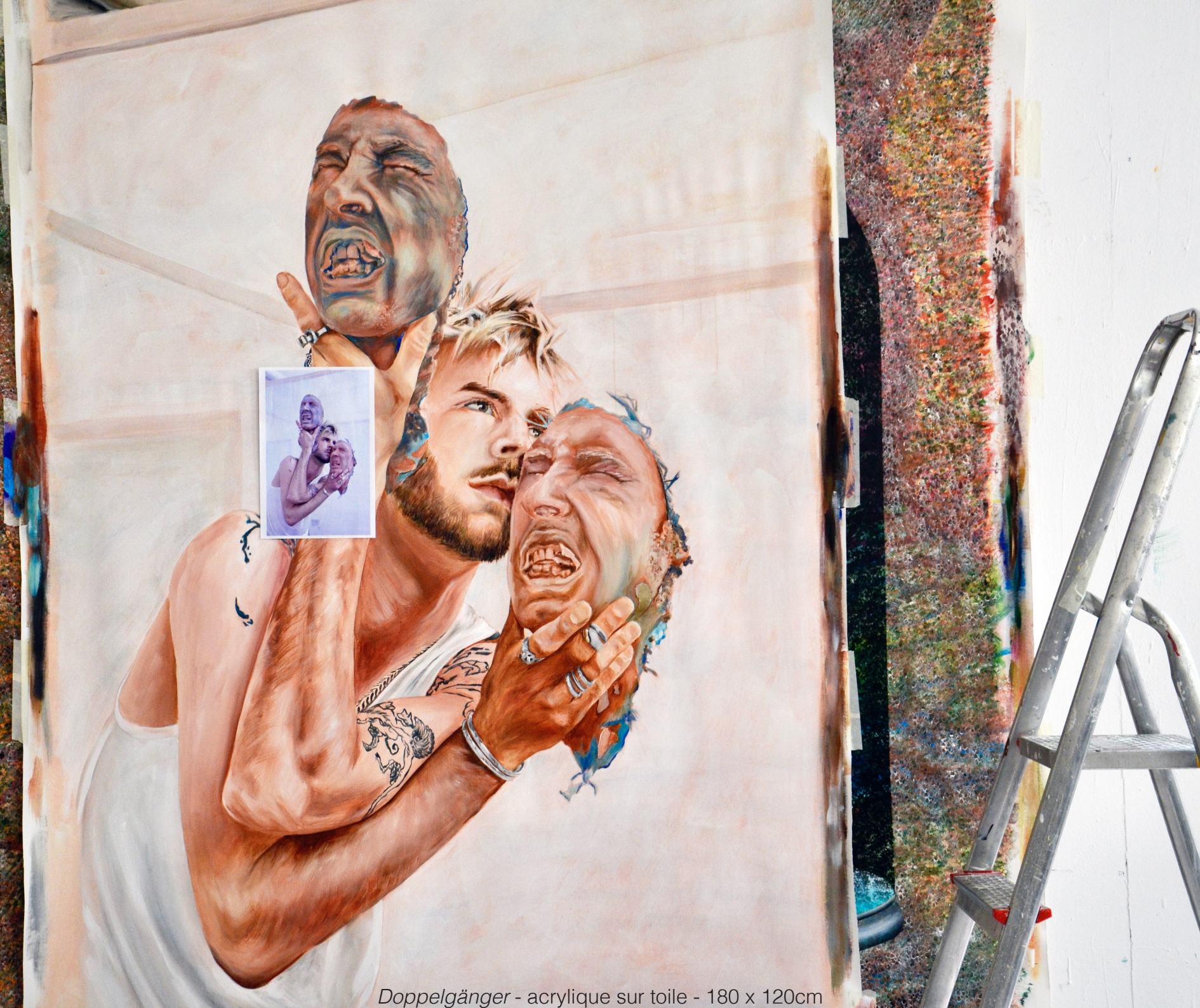
Doppelgänger - acrylique sur toile - 180 x 120cm