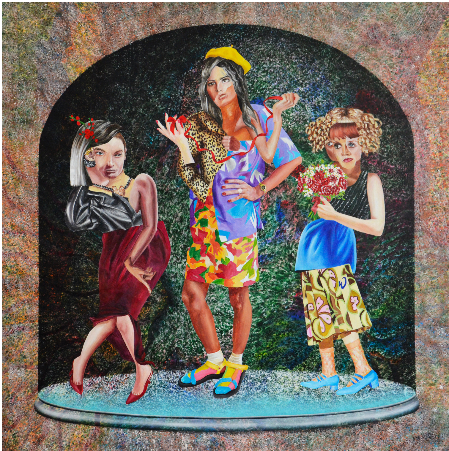
First date - acrylique sur toile - 180 sur 180cm