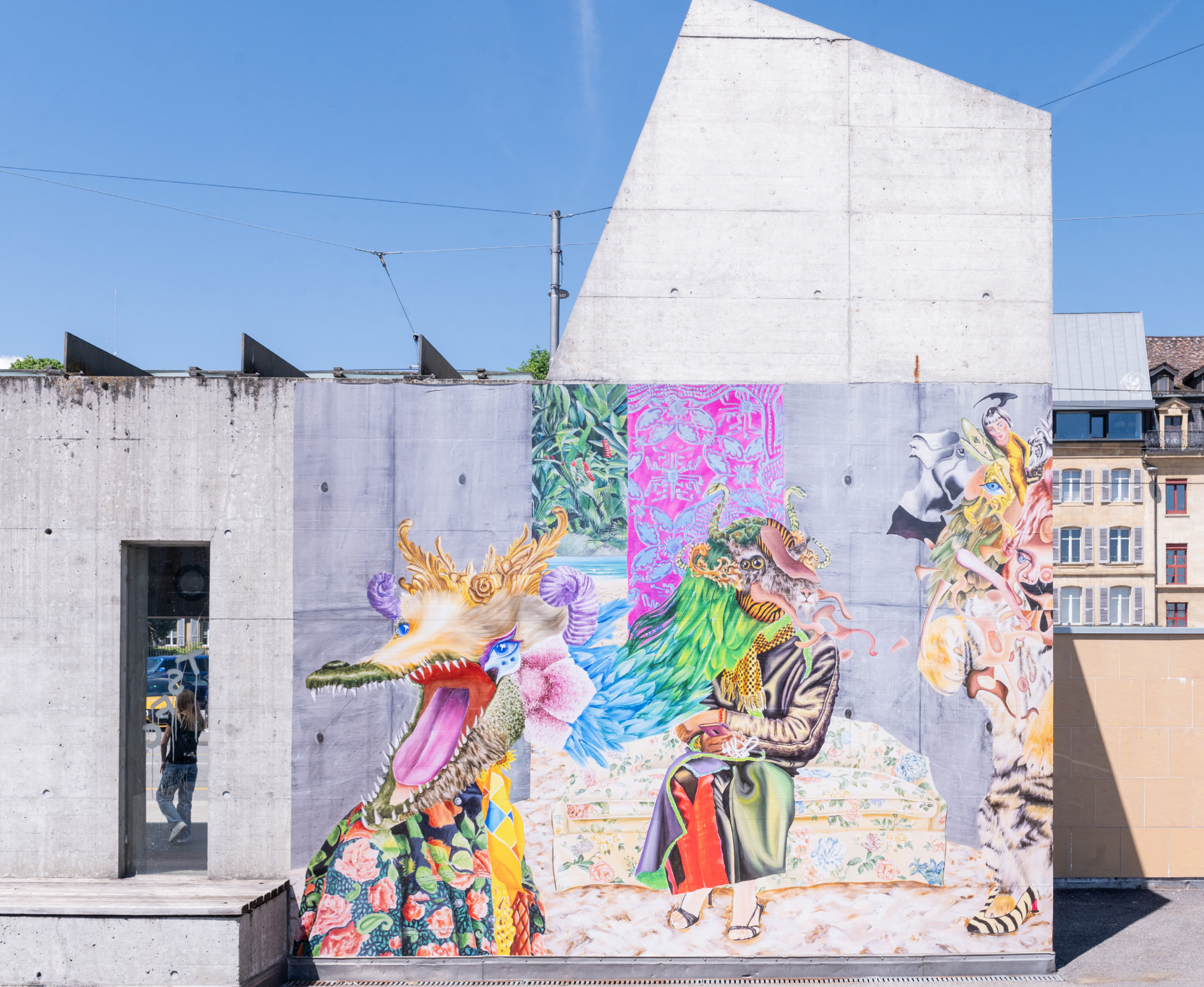
Exposition Panart Neuchâtel - trip sur le sofa 2/2 - impression autoadhésive - 350 x 200cm