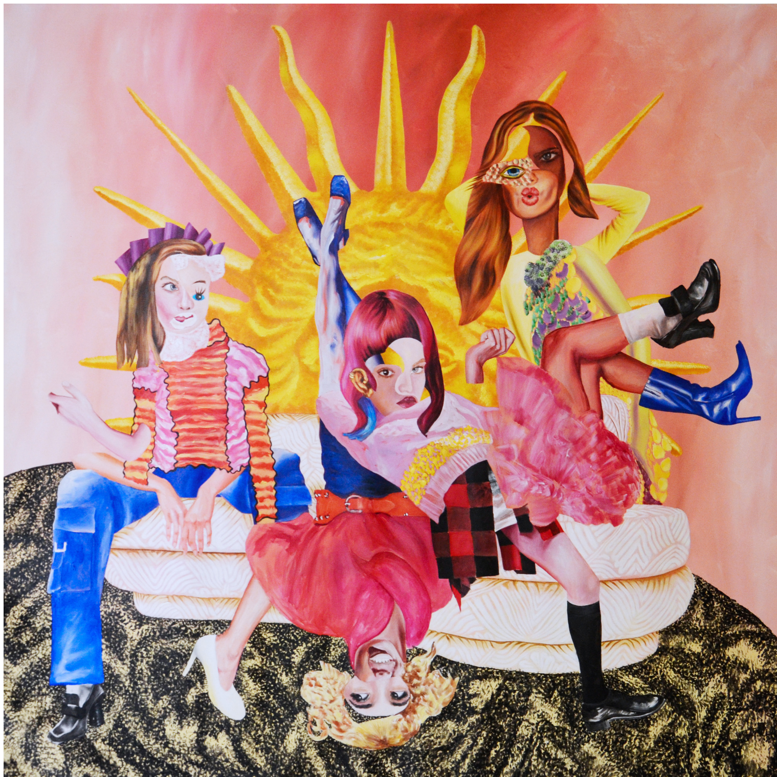
Die Sonne scheint - acrylique sur toile - 180 sur 180cm