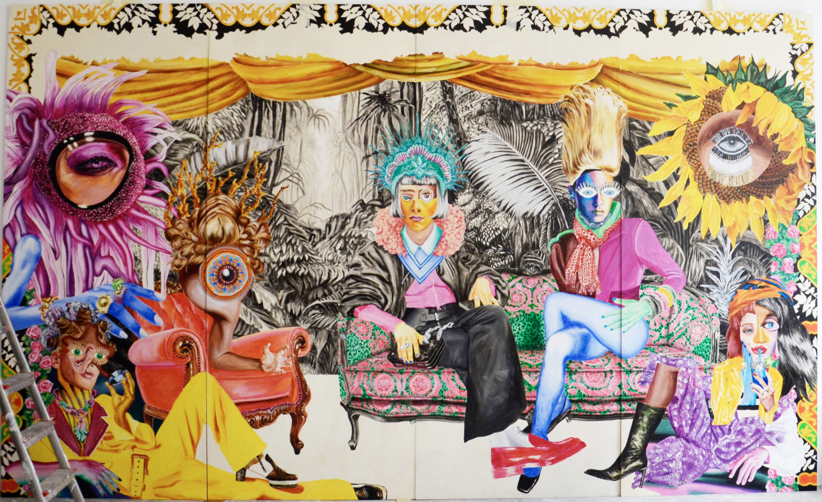
Trip sur le sofa 1/2 - acrylique sur bois - 400 x 240cm